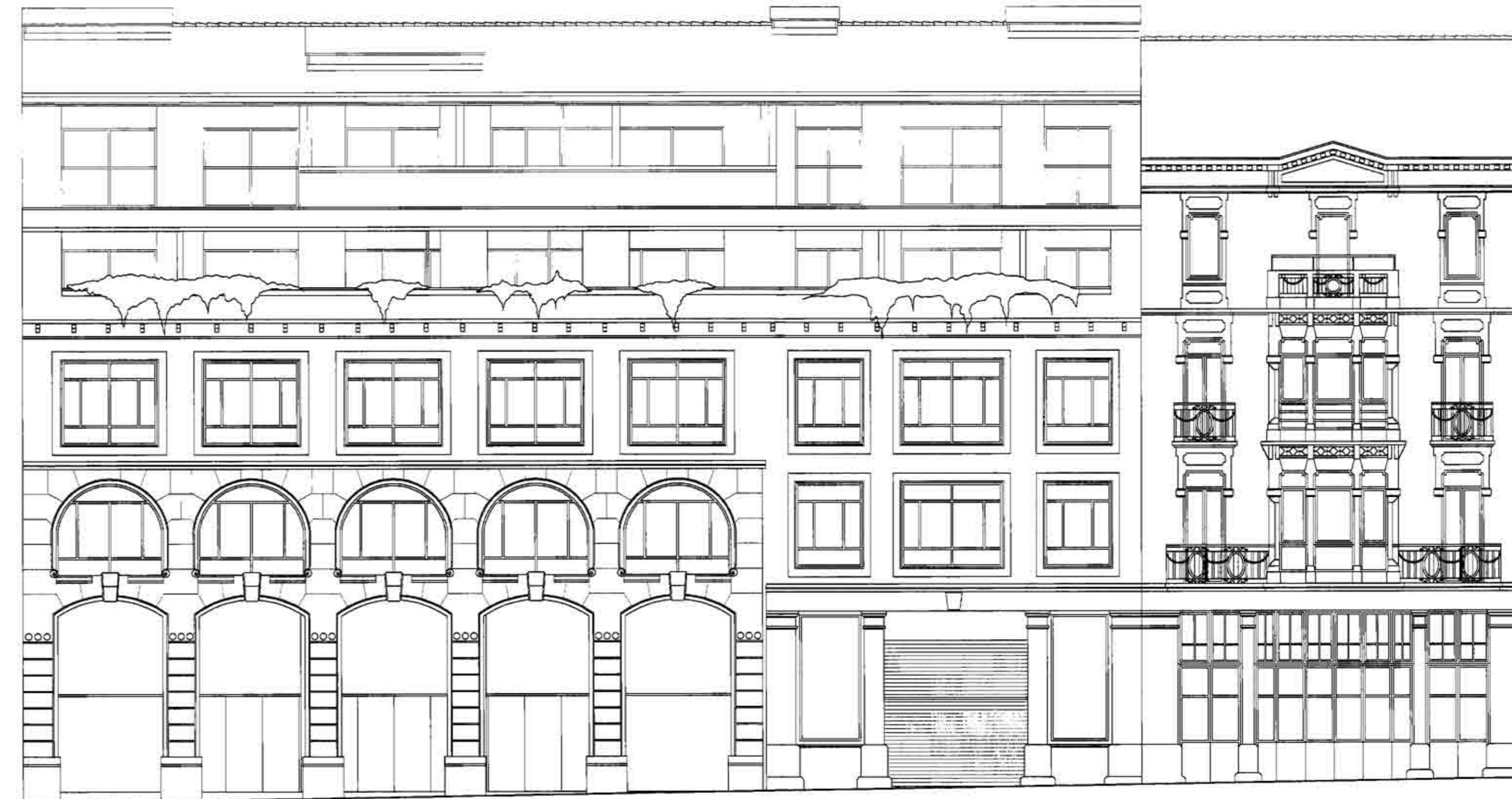
ALÇAT PRINCIPAL PROPOSTA. ESCALA 1:100