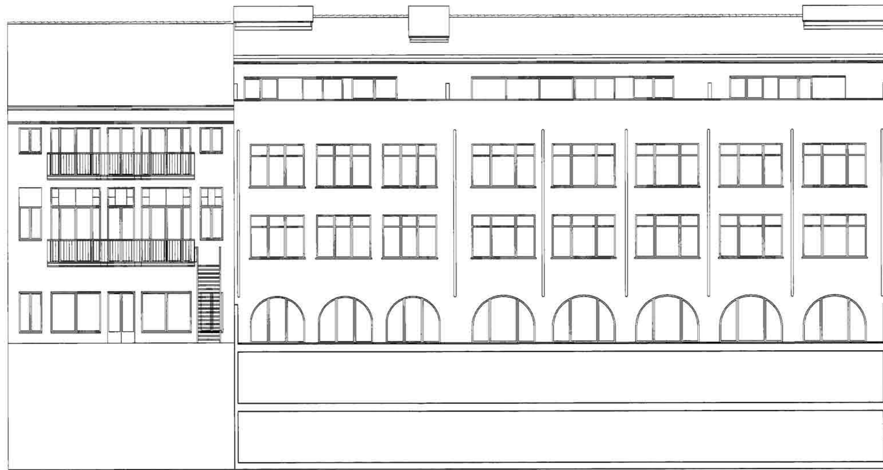
ALÇAT POSTERIOR PROPOSTA. ESCALA 1:100