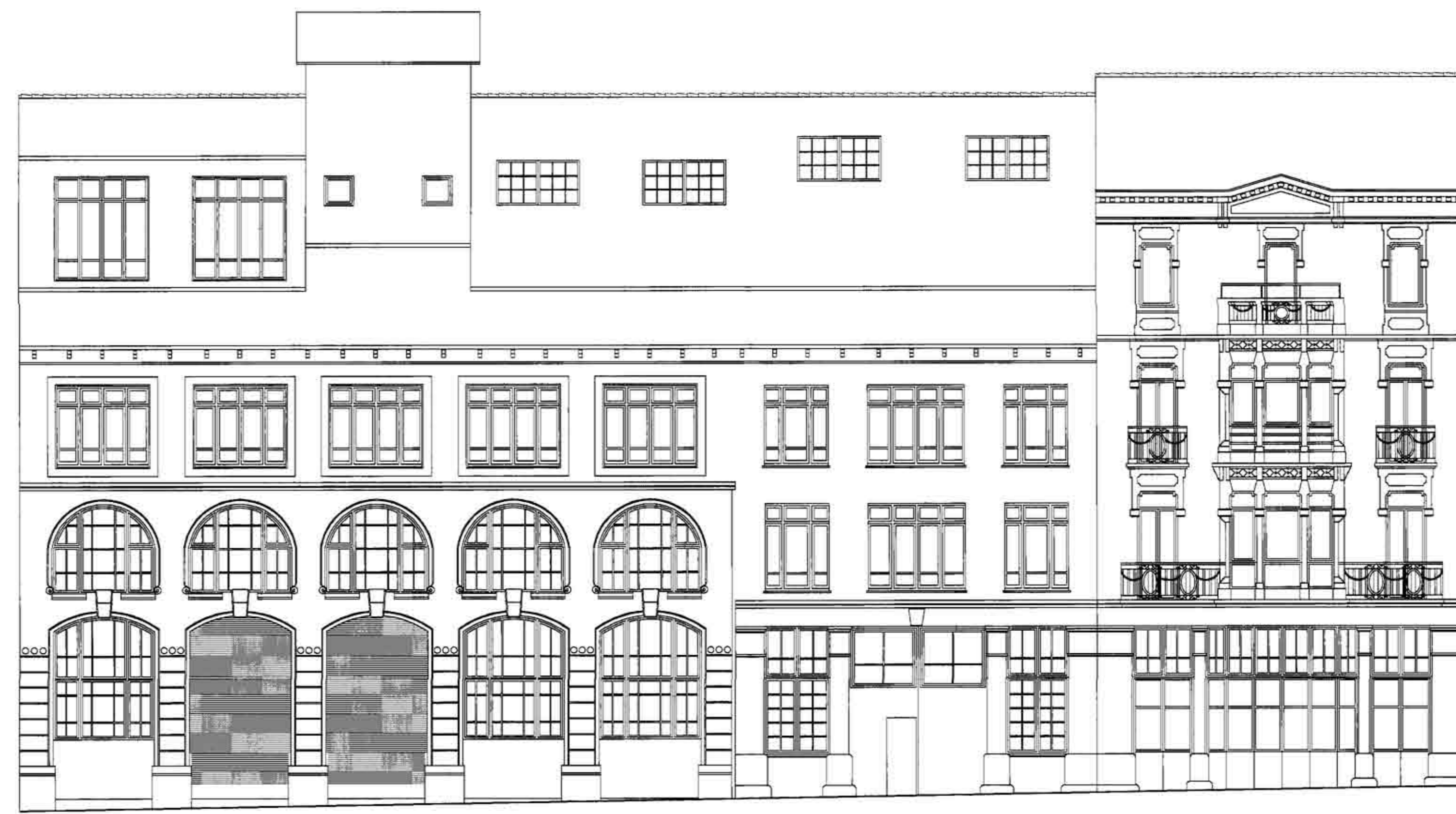
ALÇAT PRINCIPAL ACTUAL. ESCALA 1:100